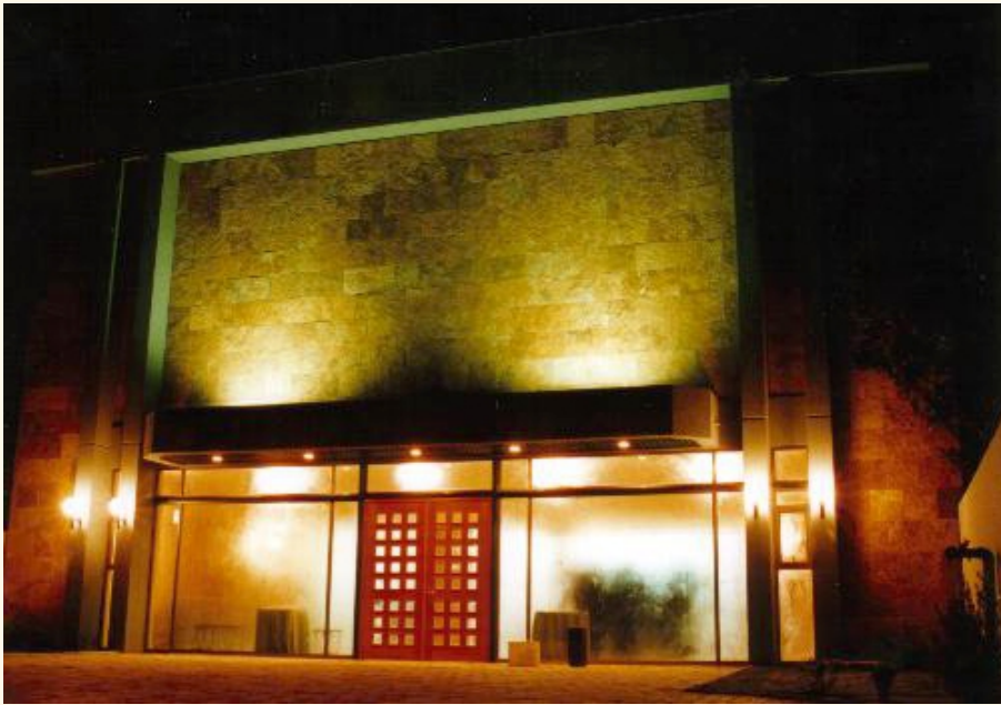
Hermosa vista nocturna del frente del nuevo edificio de la Masonería en Valdivia